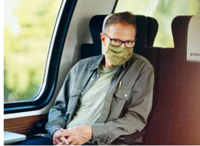
Bänz Friedli Autor und Kabarettist

Haltestelle mit Umsteigemöglichkeit aufs Flugzeug.