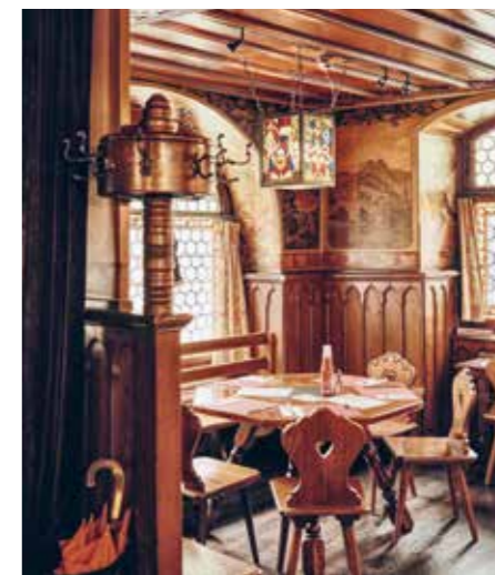
Vorbei an der Hammer Brocki, über die alte Holzbrücke, bis in den Rathauskeller, auch bekannt als «Chöbu».