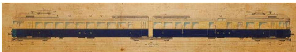
Der BCFZe 4/6 Nr 731 im Ablieferungszustand von 1938