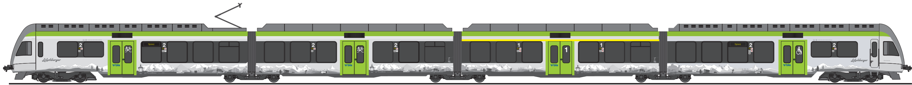
Wagen 2. Klasse