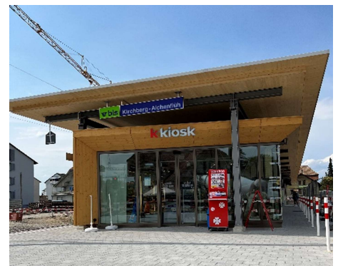
Perrondach und Kiosk Gleis 1

Infos zum Bauprojekt: bls.ch/kirchberg-alchenflueh