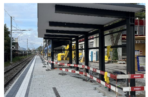
Schwäbis: Neues Perron mit Unterstand