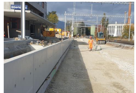
Umbauarbeiten beim Bahnhof Biberist Ost

Infos zum Bauprojekt: bls.ch/bauprojekte