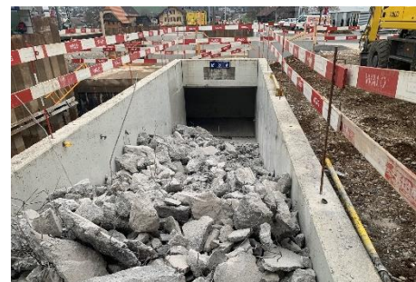
Heimberg: Rückbau alte Treppe Ost