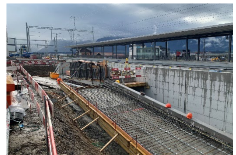
Steffisburg: Rampe Ost in Bau